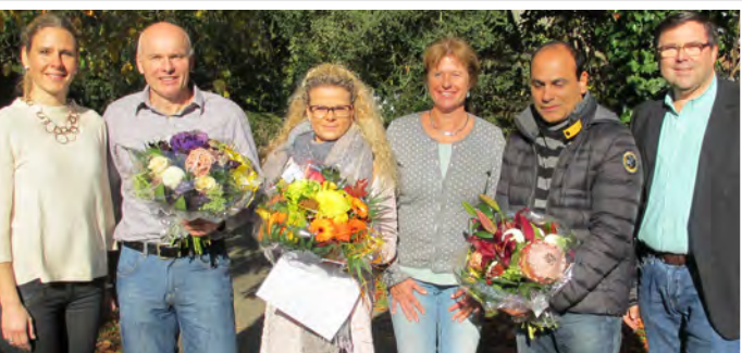
Preisträger des Landespflegepreis 2017 bei der Verleihung im Rahmen der Landestagung des BFLK Hessen am 1. November 2017.

Der erste Preisträger erhält 500,- € , der zweite Preis ist mit 300,- € ausgelobt und der dritte Preisträger erhält 200,- € .